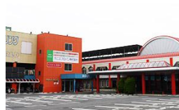
アソビックスあさひ