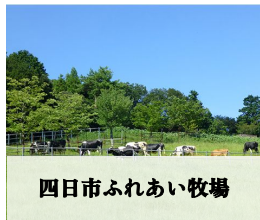
四日市ふれあい牧場