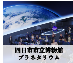
四日市市立博物館 プラネタリウム