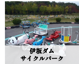
伊坂ダム サイクルパーク