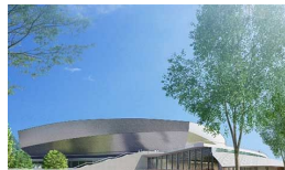
四日市スポーツランド