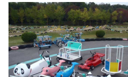
伊坂ダム サイクルパーク