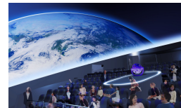
四日市市立博物館 プラネタリウム